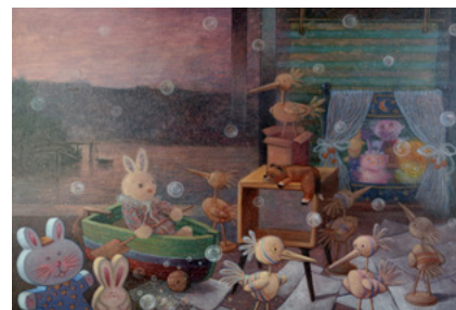
José Carlos San Martín Sedano - Irun "Singular reunión" Olíoa eta akrilikoa / Óleo y acrílico