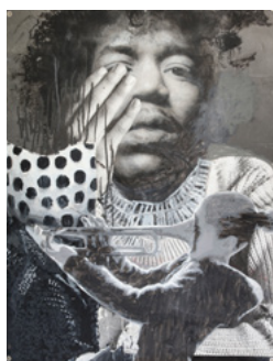
Jon Jauregi Zubeldia - Urnieta "Black Rhythm" Olíoa + akrilikoa + collagea / Óleo + acrílico + collage